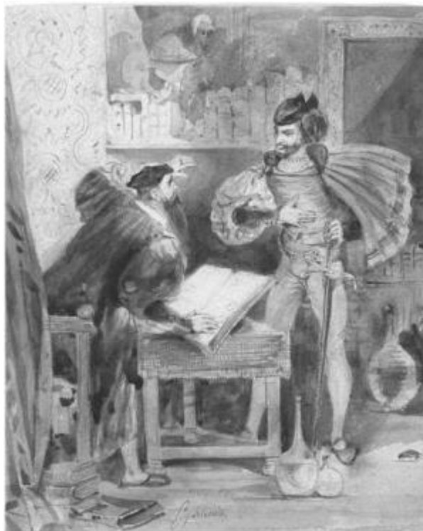
Faust et Méphistophélès

■ OILETTE : Démon peu connu, invoqué dans les litanies du sabbat.